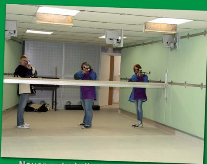
Neuer unterirdischer 50 m-Schießstand