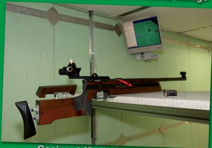
Geeignet für Waffen bis 1.500 Joule