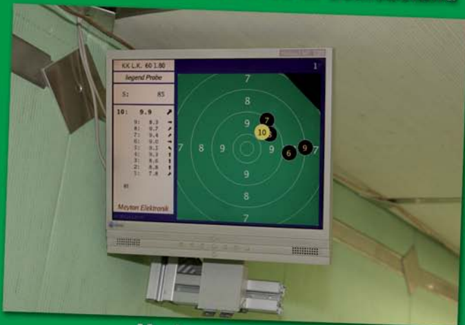
Moderne elektronische Anlage