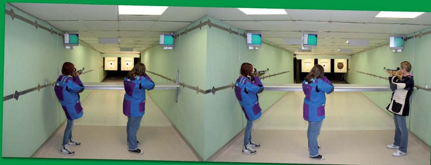
Fünf 50 m-Bahnen (bis 1.500 Joule)