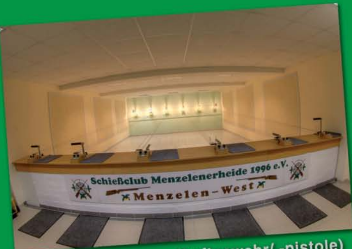
Sechs 10 m-Bahnen (Luftgewehr/ -pistole)